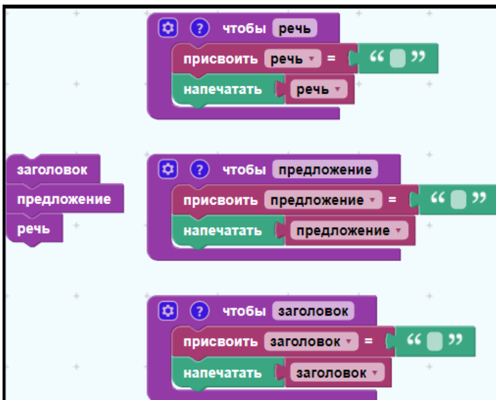
Рис. 4. Шаблон программы