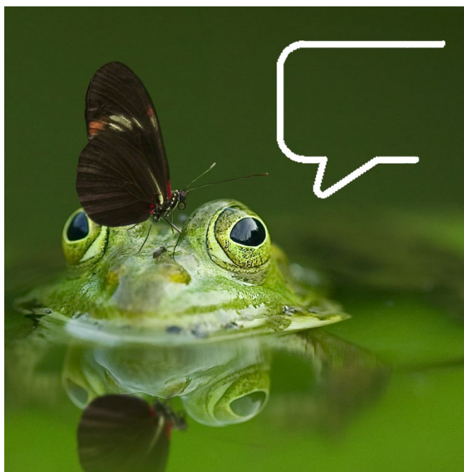
Рис. 1. Пример изображения

Представлена коллекция изображений разного типа. К сожалению, они не имеют никаких названий или объяснений. Ваша задача будет заключаться в том, чтобы придумать для них имена, выражающие ваше восприятие того, что вы на них видите.