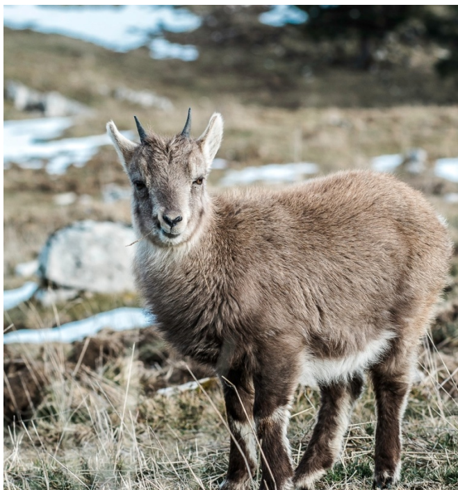
Рис. 2. Пример изображения